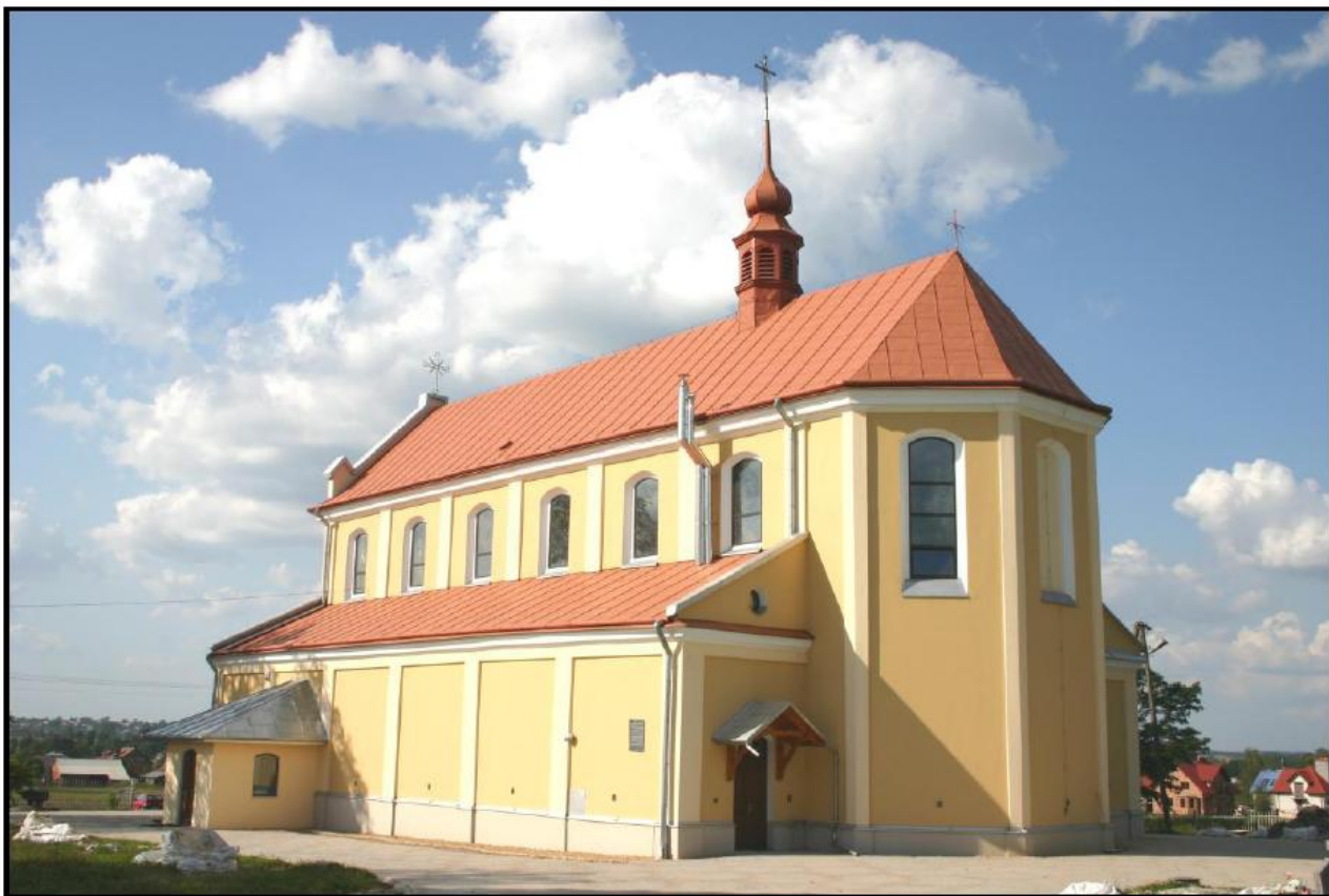
Fot. 3. Kościół parafialny p.w. Opatrzności Bożej w Trzeboszi (Nr rej. A-49 z 4.03.2002)