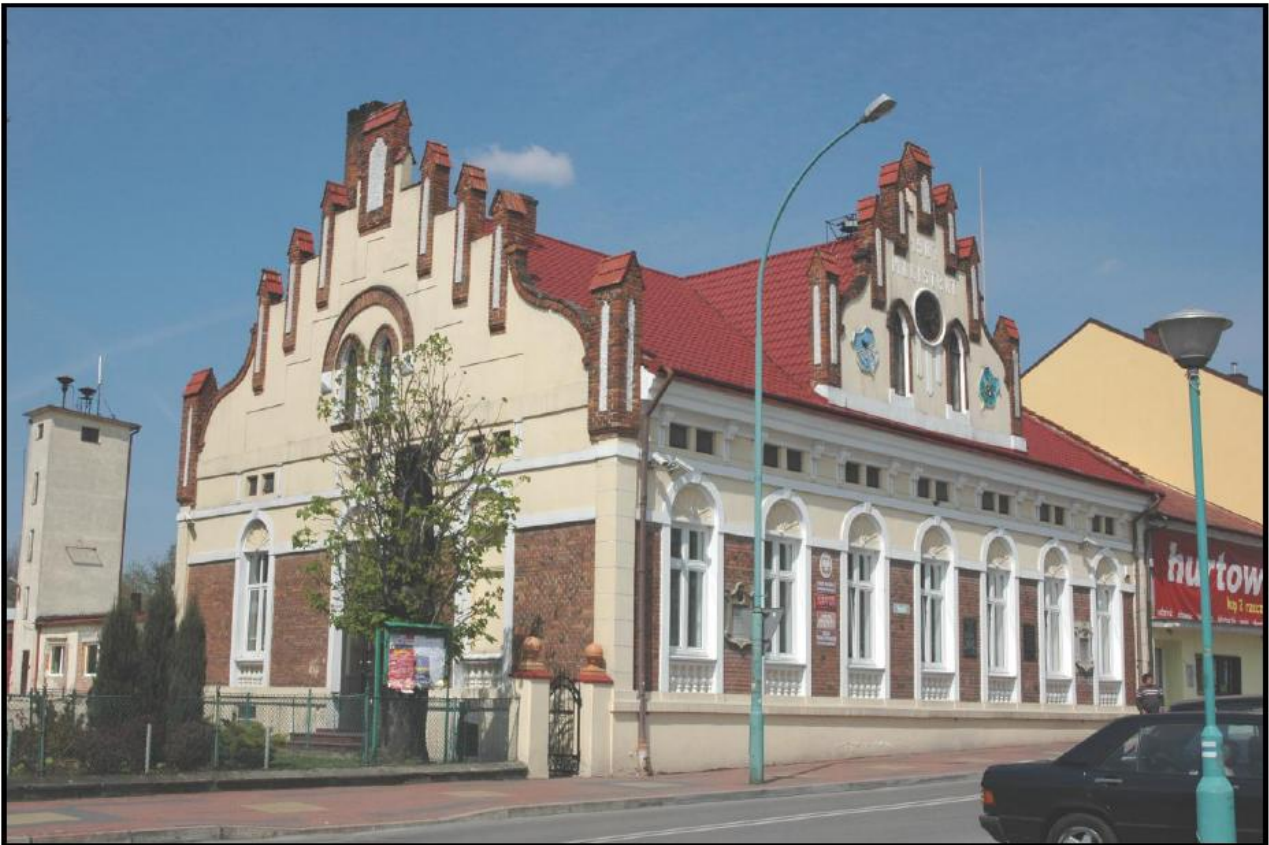
Fot. 2. Dawny magistrat, ob. UGiM w Sokolowie Małopolskim (Nr rej. A-493 z 17.02.2011)