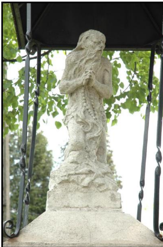
Fot. 6. Figura św. Onufrego w Sokolowie Małopolskim