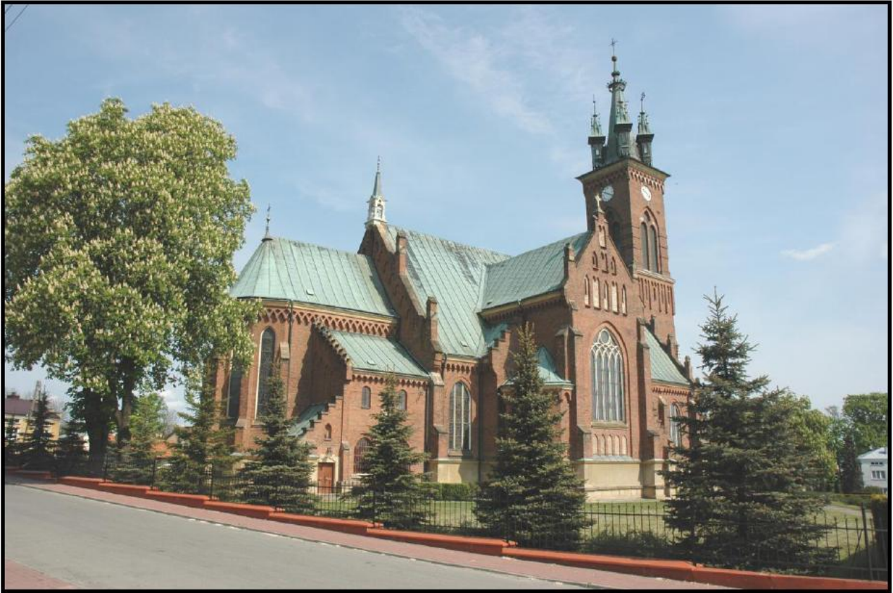
Fot. 1. Kościół parafialny p.w. św. Jana Chrzciciela w Sokolowie Małopolskim