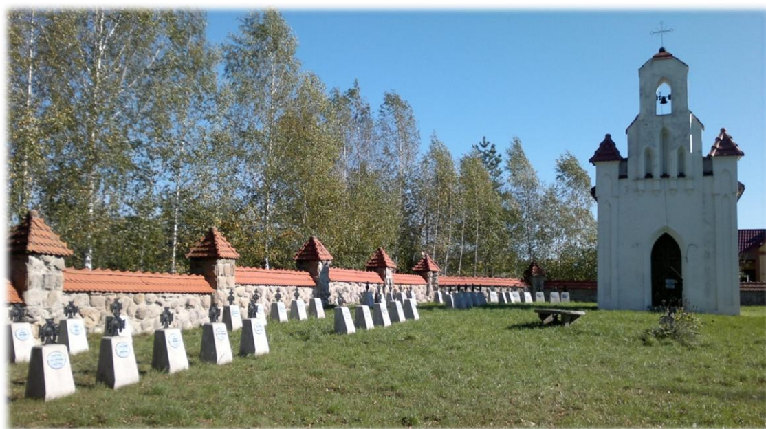
Cmentarz wojenny nr 220 oraz kaplica p.w. Św. Leonarda w Kleciach

Spośród cmentarzy wpisanych do rejestru zabytków najlepiej zachowany jest cmentarz wojenny nr 220 w Kleciach (z zachowaną na jego terenie kaplicą p.w. Św. Leonarda). Pozostałe zabytkowe nekropolie to cmentarz nr 217 w Januszkowicach, cmentarz nr 218 w Bukowej oraz cmentarz nr 227 w Gorzejowej, Brzostku nr 222 i Zawadce Brzosteckiej nr 226 Cmentarz niewpisane do rejestru znajdują się także w Przeczycy.