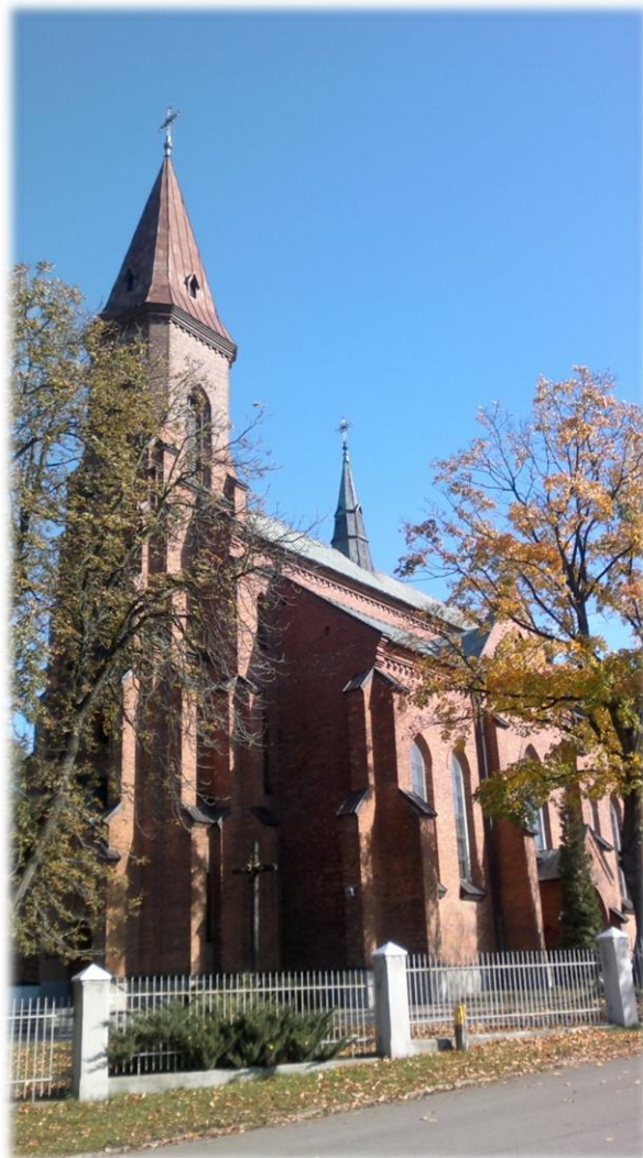
Sanktuarium NMP Wniebowziętej w Przeczycy