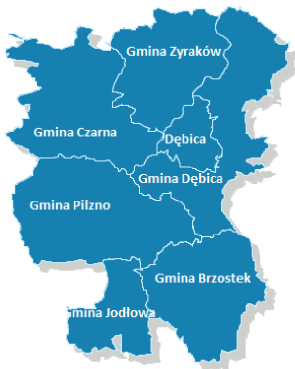
Położenie Gminy Brzostek na tle powiatu dębickiego

Gmina Brzostek położona jest w zachodniej części województwa podkarpackiego i terytorialnie przynależy do powiatu dębickiego. Leży na pograniczu Pogórza Ciężkowickiego i Strzyżowsko - Dynowskiego, wchodzącego w skład Pogórza Karpackiego. Graniczy z gminami: Jodłowa, Pilzno, Dębica, Brzyska, Kołaczyce, Fryszak, Wielopole Skrzyńskie i Ropczyce. Położona jest w odległości ok. 27 km od Dębicy - siedziby powiatu i 75 km od Rzeszowa - siedziby województwa.