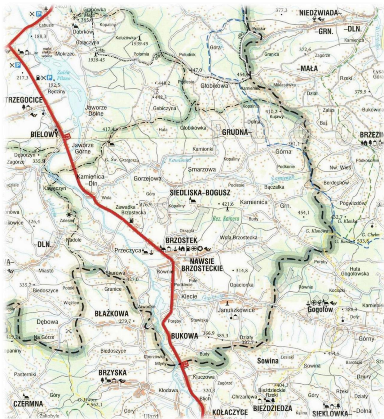
Mapa Gminy Brzostek

Gmina Brzostek liczy 13 204 mieszkańców (stan na 31 grudnia 2014 roku), co stanowi ok. 9,77 % ludności terenu powiatu dębickiego, w którym zamieszkuje blisko 6,34 % ogółu mieszkańców województwa podkarpackiego. Powierzchnia gminy to 123 km 2 , co daje gęstość zaludnienia 107,35 osób/km 2 . Siedzibą Gminy jest miasto Brzostek, liczący wg oficjalnych danych z 31 marca 2011 roku 2755 mieszkańców, co stanowi niemal dokładnie 20% ludności gminy.