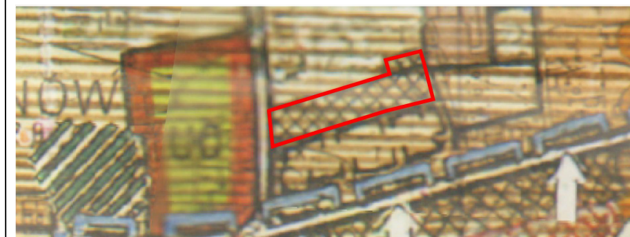
Granica obszaru objętego projektem Miejscowego planu zagospodarowania przestrzennego nr 1/2019 terenu położonego przy ul. Polnej w Dynowie