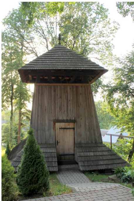
Zdjęcie nr 2. Dzwonnica przy kościele rzymsko - katolickim parafialnym pw. Narodzenia NMP, Jaksmanice

Dzwonnica prezentuje typ dzwonnicy o ścianach zwężających się ku górze, bez wyraźnych cech stylowych. Dzwonnica usytuowana jest na płn. -zach. krańcu wzniesienia, tuż przy krawędzi zbocza.