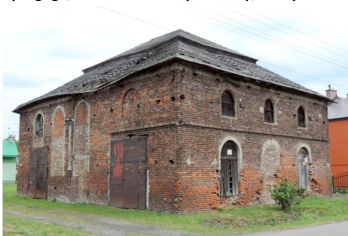
Zdjęcie nr 8. Synagoga, ob. obiekt nieużytkowany, Medyka

Synagoga powstała na pocz. XX w. Podczas II wojny światowej została zdewastowana przez hitlerowców. Po zakończeniu wojny użytkowana jako magazyn, obecnie jest nieużytkowana i popada w ruinę.