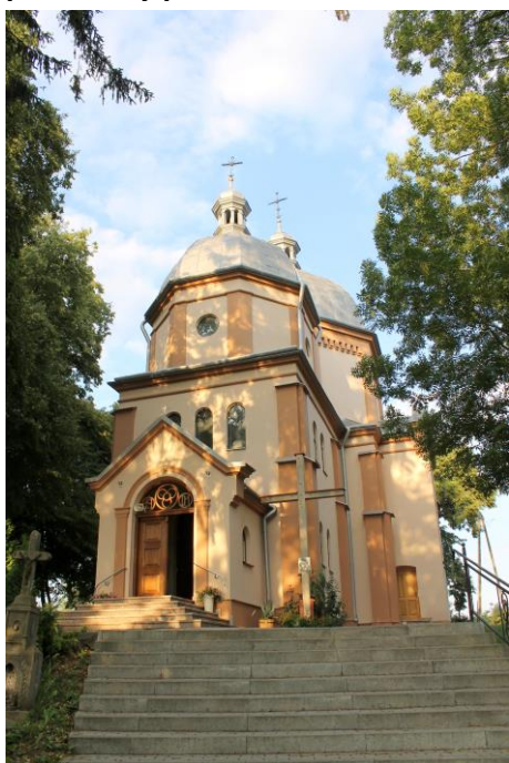
Zdjęcie nr 1. Cerkiew grekokatolicka parafialna pw. Opieki NMP, ob. kościół rzymsko - katolicki parafialny pw. Narodzenia NMP, Jaksmanice

Cerkiew grekokatolicka parafialna pw. Opieki NMP, ob. kościół rzymsko - katolicki parafialny pw. Narodzenia NMP, Jaksmanice