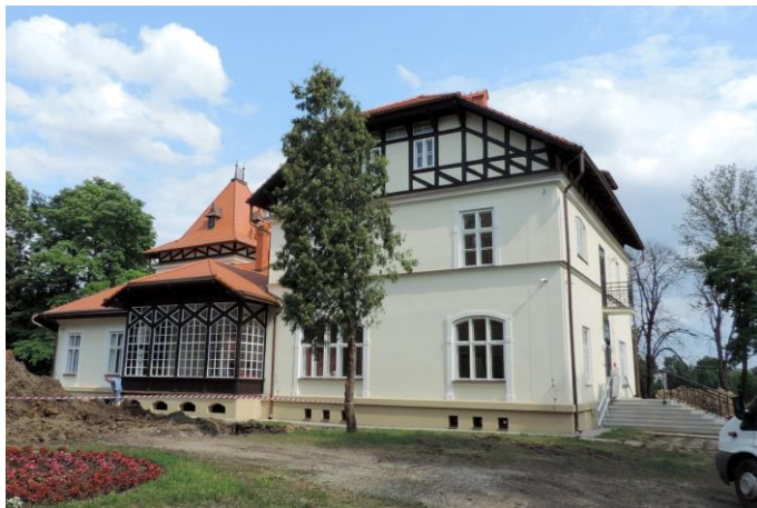
Zdjęcie nr 12. Dom gościnny w zespole dworsko - parkowym, Medyka