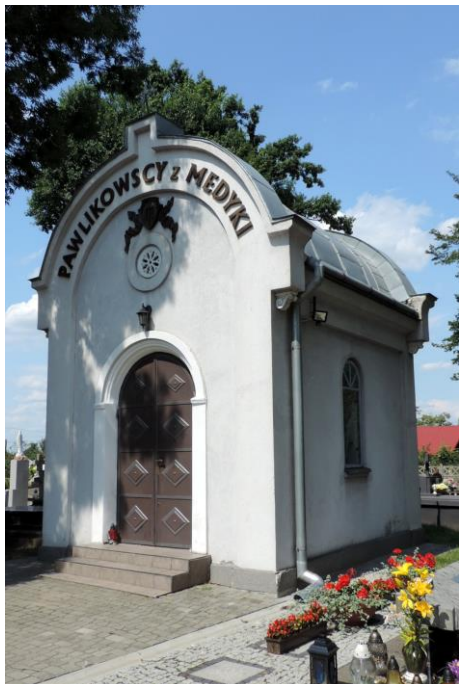
Zdjęcie nr 9. Kaplica cmentarna - grobowa Pawlikowskich

Kaplica pochodzi z k. XIX w. - pocz. XX w., usytuowana w centralnej części cmentarza, przy głównej alei, w otoczeniu nagrobków, orientowana. Kaplica na rzucie prostokąta, z otworem drzwiowym na osi ściany zach. Kaplica jednoprzestrzenna, na niewielkim cokole, nakryta dwuspadowym dachem siodłowym, walcowatym osłoniętym półkuliście szczytami, we frontowej elewacji wydatny klucz, na którym osadzono krzyż. W podłuczcu szczytu na opasce współczesny napis - Pawlikowscy z Medyki. Wewnątrz obraz z przedstawienie Chrystusa Króla. Stan zachowania - bardzo dobry.