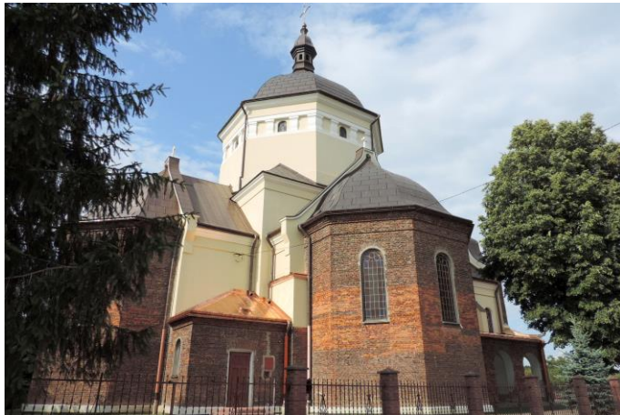
Zdjęcie nr 7. Cerkiew grekokatolicka, obecnie kościół rzymsko - katolicki parafialny pw. Wniebowzięcia NMP, Torki

Osada Torki wzmiankowana była w źródłach po raz pierwszy w 1446 r. Pierwotna drewniana cerkiew wzniesiona została jednak dopiero w XVII w., wzmiankowana w 1661 r. Uległa zniszczeniu w czasie I wojny światowej. Pozostałością pierwotnego zespołu cerkiewnego jest drewniana dzwonnica konstrukcji słupowo - ramowej, przeniesiona w 1993 r. do Chotyńca. W 1926 r. grekokatolicka społeczność ówczesnej wsi podjęła decyzję o budowie nowej murowanej świątyni w 1926 r. Budowę ukończono w 1937 r., pozostawiając nie wykończone elewacje. Po II wojnie światowej i wysiedleniu miejscowej społeczności ukraińskiej cerkiew została przejęta w 1946 r. przez kościół rzymsko - katolicki, jako filialna świątynia parafii w Medyce. Mimo szeregu prac adaptacyjnych świątynia zachowała pierwotną bryłę oraz charakter wnętrza.