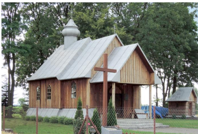
Zdjęcie nr 4. Cerkiew - kaplica liturgiczna, grekokatolicka pw. Trójcy Świętej, ob. cerkiew parafialna, Leszno

Cerkiew wybudowana jako kaplica liturgiczna w 1858 r., opuszczona po 1947 r. została wyremontowana i rozbudowana w latach 1991 - 1993. Kaplica usytuowana jest ku zach., na ptn. - zach. skraju wsi, na płaskim terenie, zadrzewionym nieregularnie. W ptn. - zach. części placu domkowa kapliczka, pomiędzy nimi nieoznakowane mogiły.