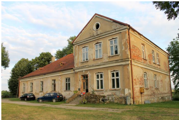
Zdjęcie nr 11. Dwór w zespole dworsko - parkowym, Hurko

Wieś Hurko wzmiankowana już w XIV w. Od poł. XIX w. do pocz. XX w. należała do rodziny Skarbków - Borowskich, a następnie została przekazana Saletynom z Przemyśla, którzy pod koniec lat 40 - tych otoczyli zespół dworsko - parkowy betonowym murem, wykorzystując wcześniejsze ceglane ogrodzenie. Dwór w obecnej postaci powstał zapewne po 1852 r., gdyż plan katastralny przedstawia inny rzut budynku. Istotnym elementem ówczesnego układu przestrzennego były dwie duże kwatery ogrodów użytkowych, usytuowane we wsch. i zach. części założenia, które w formie szczątkowej dotrwały do dzisiaj. Po 1950 r. zespół został przejęty przez PGR.