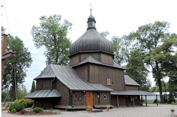
Zdjęcie nr 3. Cerkiew grekokatolicką pw. Św. Bazylego Wielkiego, ob. kościół rzymsko - katolicki parafialny pw. Niepokalanego Poczęcia NMP, Leszno

Wieś wzmiankowana po raz pierwszy w 1589 r. Z kolejnej daty - 1614 r., wynika, że w miejscowości znajdowała się cerkiew parafialna. Obecna została wzniesiona w 1737 r., o czym świadczy napis na belce nad zach. wejściem, który został zniszczony w trakcie remontu w latach 80 - tych XX w.