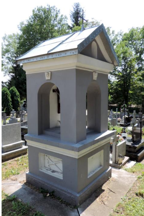
Zdjęcie nr 10. Kaplica grobowa Sienkiewiczów