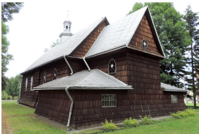
Zdjęcie nr 5. Kościół parafialny pw. św. Piotra i Pawła, Medyka

Drewniany kościół wzniesiony został w latach 1607 - 1608, współcześnie z fundacją parafii przez króla Zygmunta III Wazę. Obecna forma kościoła różni się od pierwotnej postaci, którą uzyskano w wyniku gruntownej przebudowy świątyni w 1850 r.