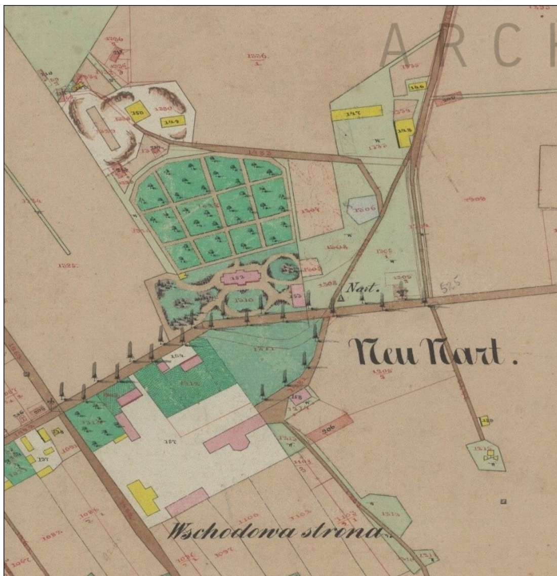
Rysunek 3. Fragment austriackiej mapy katastralnej z 1853 r. przedstawiający dwór oraz park dworski w Nowym Narcie wraz z otoczenie. AP Przemysł, Archiwum Geodezyjne, Dorf Nart sammt Colonie Neu Nart In Galizien Rzeszower Kreis [Mapa wsi Nart z kolonią Neu Nart w Galicji w obwodzie rzeszowskim], sygn. 56/126/0/0/1113M.