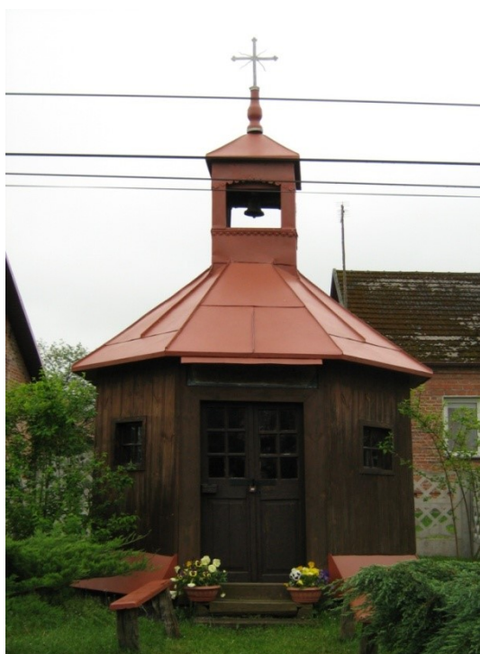
Rysunek 1. Kaplica św. Zofii i św. Tomasza w Zalesiu.