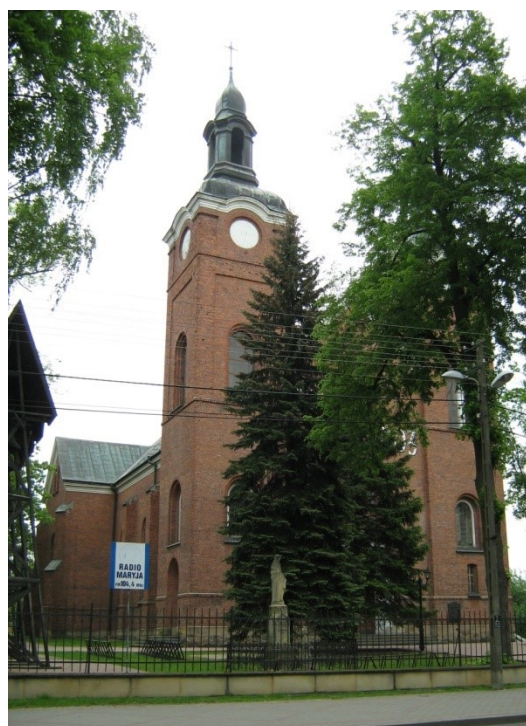
Rysunek 2. Kościół parafialny p.w. Narodzenia Najświętszej Marii Panny w Jeżowie