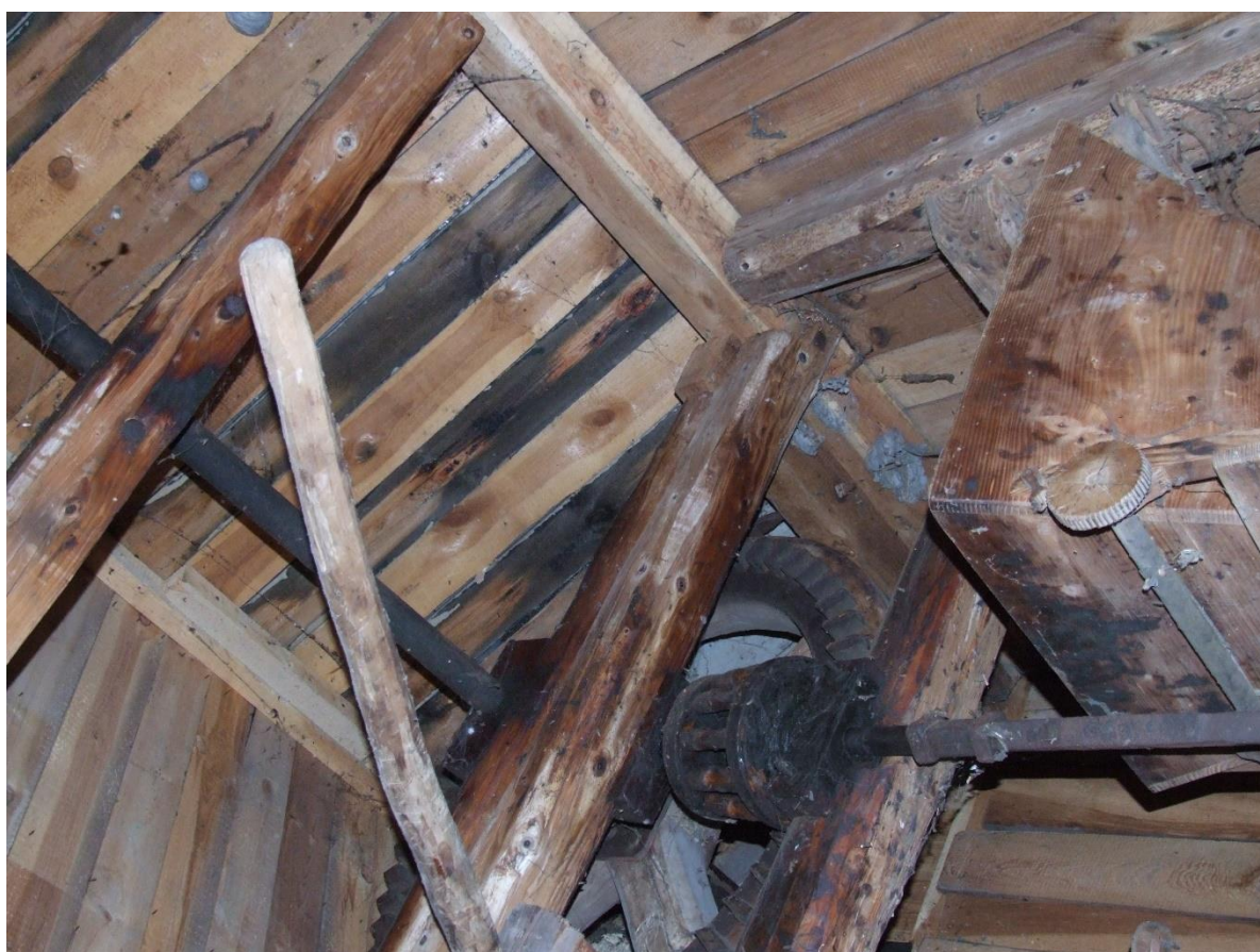
Wiatrak drewniany w Bystrzycy, 1948 r., wewnątrz