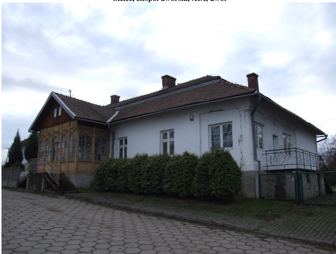
Sielec, Zespół dworski, XIX, dwór