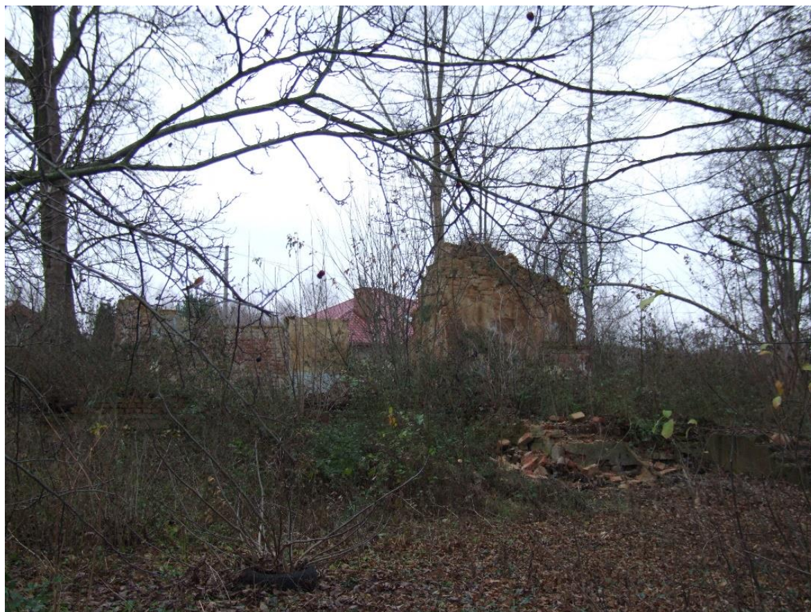
Olchowa, Zespół dworski, XVIII/XIX, ruina dworu