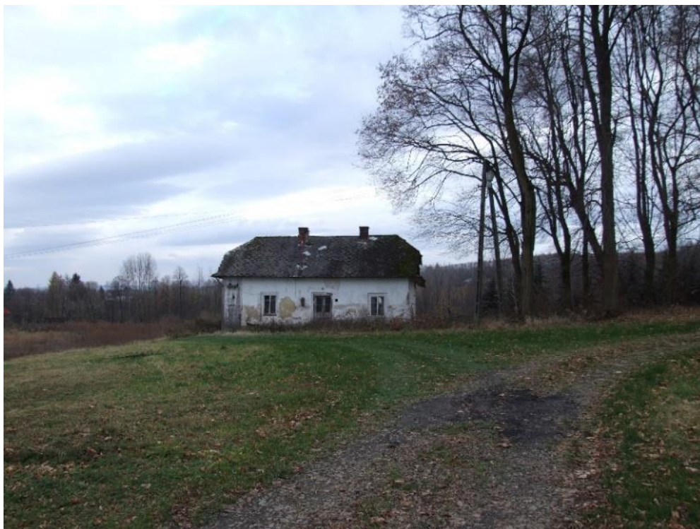
Iwierzycy, Zespół dworski, 1889, rządcówka