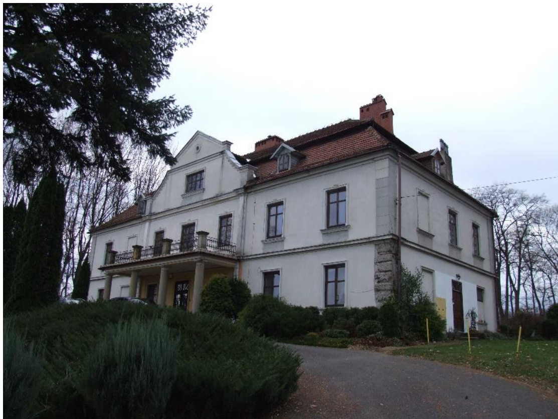
Iwierzycy, Zespół dworski, 1889, dwór