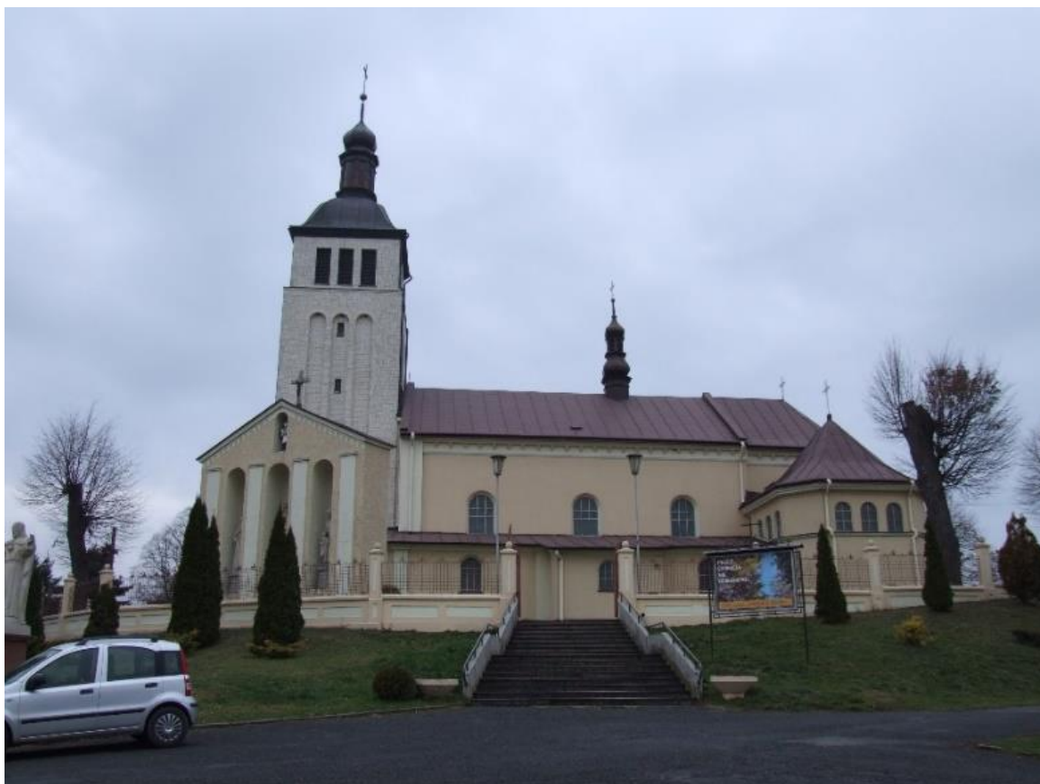
Kościół parafialny w Nockowej p.w. św. Michała Archaniola (wraz z dzwonnica)

Kościół jest murowany, orientowany, trójnawowy, bazylikowy. Prezbiterium zamknięte, wieloboczne z dobudowaną po bokach kaplicą i zakrystią, na rzucie oktagonalnym. Od zachodu znajduje się wysoka wieża, na rzucie kwadratu z wejściem głównym do świątyni w dolnej kondygnacji. Po bokach wieży umieszczone są prostokątne kruchty, przykryte dachem pulpitowym. Nad korpusem kościoła jest dach dwuspadowy, nad prezbiterium wielopołaciowy. Nad nawą główną pośrodku kalenicy umieszczona jest sygnaturka. Wieża natomiast zamknięta jest hełmem, zbliżonym kształtem do dzwonu, zwieńczonym latarnią, pokryta podobnie jak sygnaturka, blachą miedzianą.