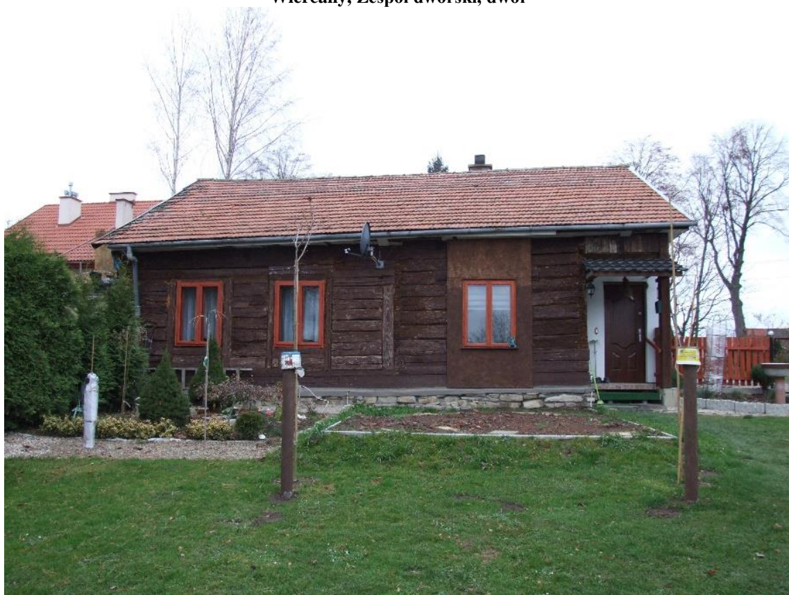
Wiercany, Zespół dworski, dwór