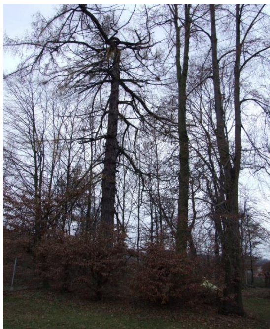
Olchowa, Zespół dworski, XVIII/XIX, park