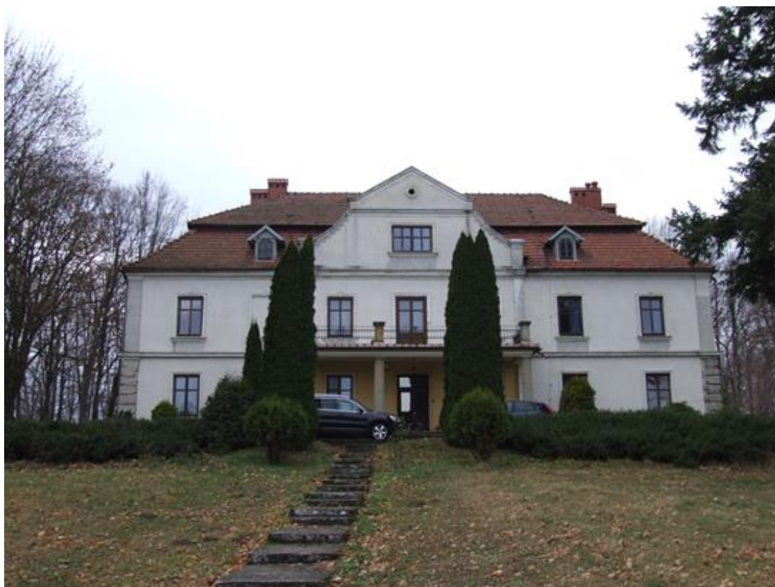
Iwierzycy, Zespół dworski, 1889, dwór