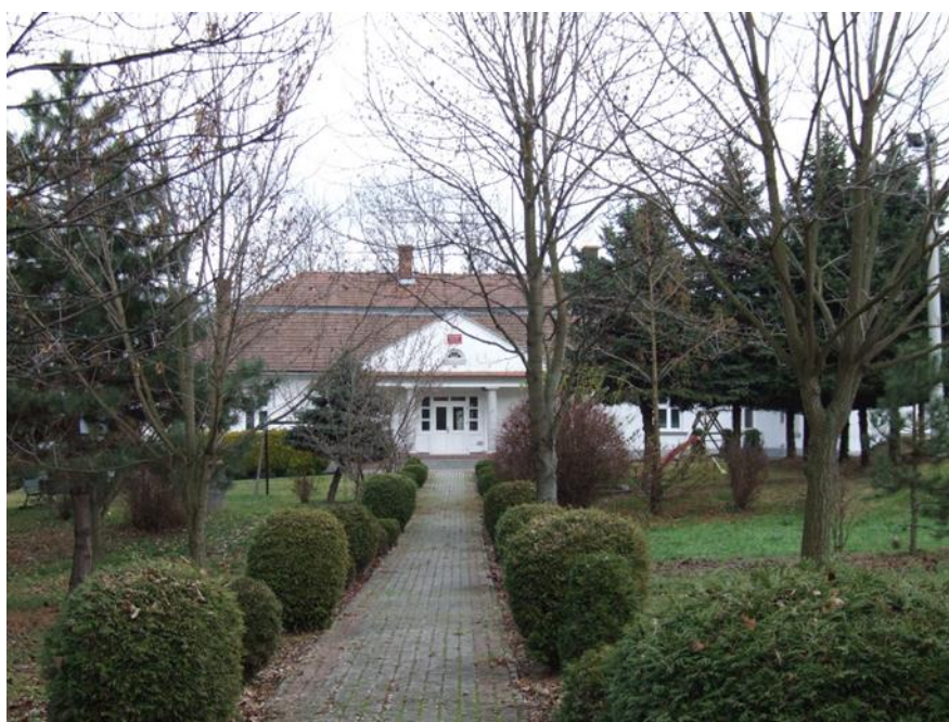
Sielec, Zespół dworski, XIX, dwór