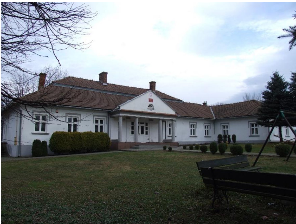
Sielec, Zespół dworski, XIX, dwór