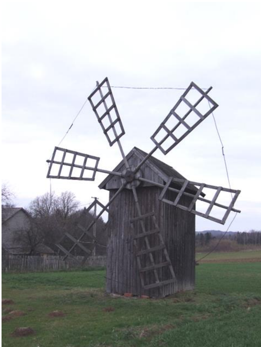
Wiatrak drewniany w Bystrzycy, 1948 r.

Brzeg króla wzmocniony jest opaską stalową. Król wbity jest w ziemię. Na krzyżaku mącznicy – zawieszona jest konstrukcja budynku. Końce krzyżaka wpuszczone są w słupy ściany nawietrznej i ścian bocznych tworzących przęsło. Drugie przęsło złożone ze słupów ściany zawietrznej jest znacznie nadwieszona. Równoważy ono ciężar urządzeń młynarskich skoncentrowanych w pierwszym przęsle. Elementem stabilizującym budynek są umieszczone pod podłogą dwie pary krzyżujących się belek obejmujących słup króla. Ściany słupowo-ramowe wzmocnione są skrzyżowanymi zastrzałami. Dodatkowym elementem wzmocniającym są poprzeczne belki podtrzymujące urządzenia młyńskie. Pomost oparty jest na krzyżaku. Belka sztygi związana jest z bocznymi ryglami. Belki podwaliny podwieszane są do belek oczepu. Ściany oszalowane są pionowo na styk. Podłoga z desek. Dach konstrukcji krokwiowej pokryty papą. Drzwi deskowe, jednoskrzydłowe. Wnętrze jednoprzestrzenne z pomostem dzielącym je na dwie kondygnacje. Posiada kompletne urządzenia napędowe i młyńskie. Obiekt w dobrym stanie zachowania. Zaleca się bieżącą pielęgnację obiektu.