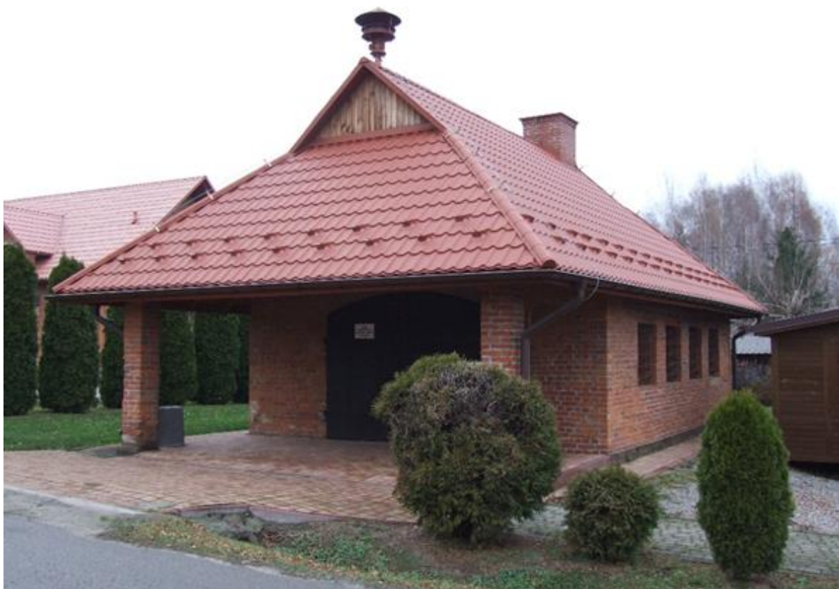
Budynek kuźni w Olimpie, obecnie remiza strażacka, ok. 1950 r.