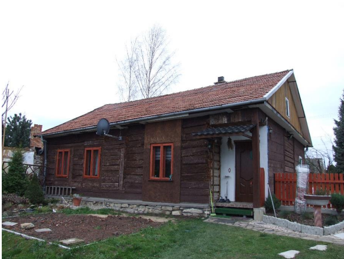
Wiercany, Zespół dworski, dwór