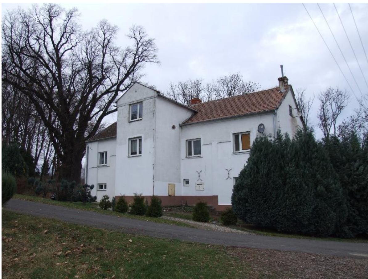
Iwierzycy, Zespół dworski, 1889, oficyna

Rządcówka, zlokalizowana w pobliżu dworu, na południowy wschód. Funkcję rządcówki budynek pełnił w okresie międzywojennym, wcześniej był prawdopodobnie dworskim lamusem. Zbudowana przed 1852 r. przebudowana po 1946 r. Wtedy zmieniono kształt dachu z czterospadowego na dwuspadowy, naczółkowy oraz zlikwidowano podcień w elewacji frontowej wspartej na słupach. Budynek jest drewniano-murowany, otynkowany. Parterowy, podpiwniczony, na rzucie prostokąta. Elewacja frontowa, trójosiowa z drzwiami wejściowymi pośrodku, okna prostokątne.