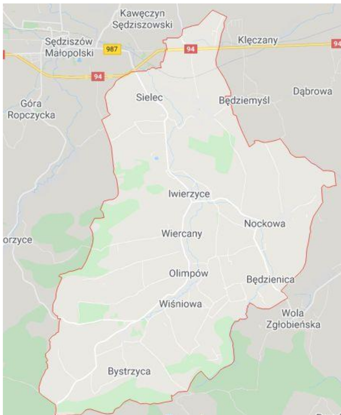
Mapa Gminy Iwierzycy