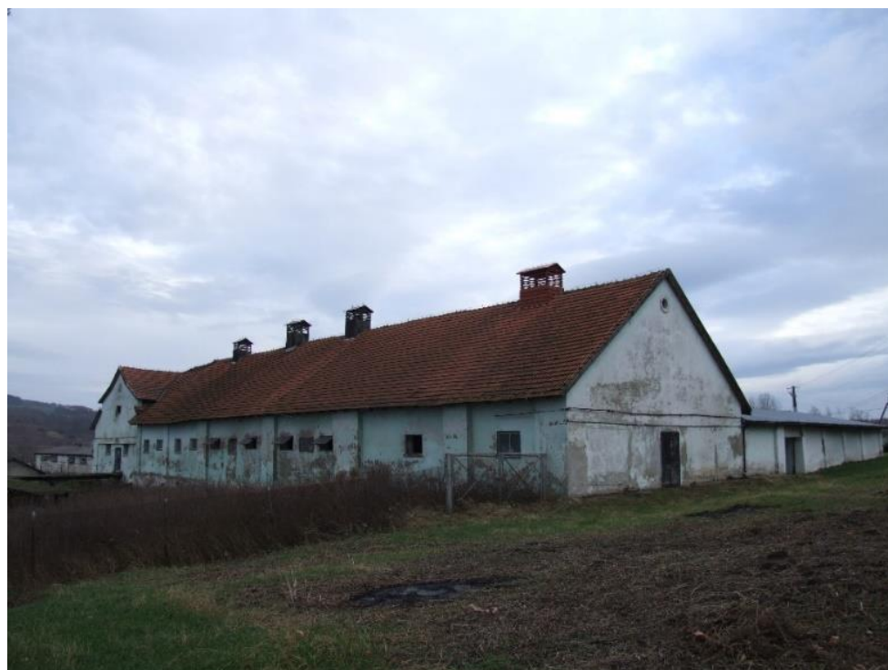
Iwierzycy, Zespół dworski, 1889, stajnie i obory

Pałac w dobrym stanie zachowania. Zaleca się bieżącą pielęgnację obiektu. Budynki gospodarcze wymagają remontu.