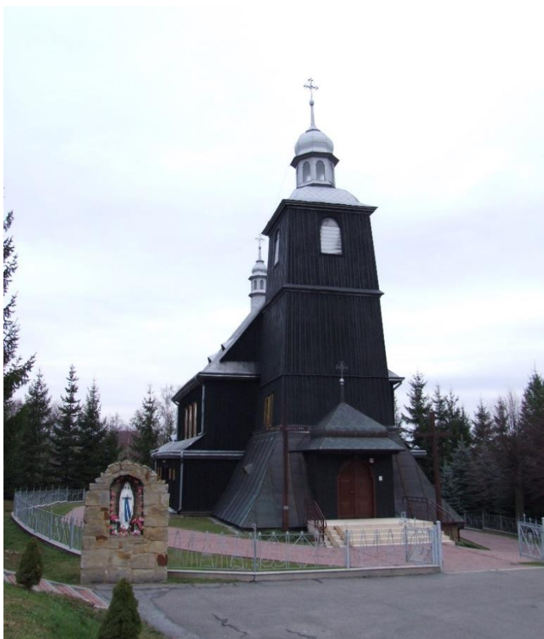
Kościół parafialny w Bystrzycy p.w. św. Franciszka z Asyżu