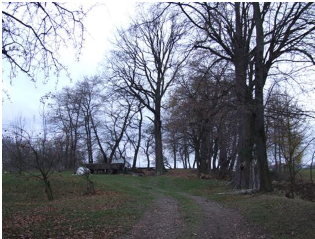
Bystrzyca, Park dworski z aleją dojazdową, XVIII/XIX

W inwentarzu w 1851 r. zanotowano, że stan dworu jest zły. Można przypuszczać, że w drugiej połowie XIX w. został on przebudowany zmieniając bryłę: w miejsce ganku kolumnowego