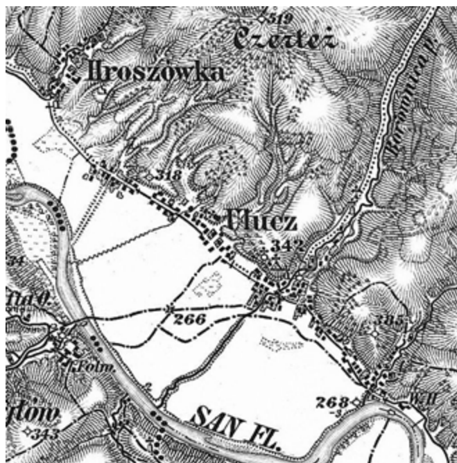
Ryc. 2. Mapa z 1887 r.