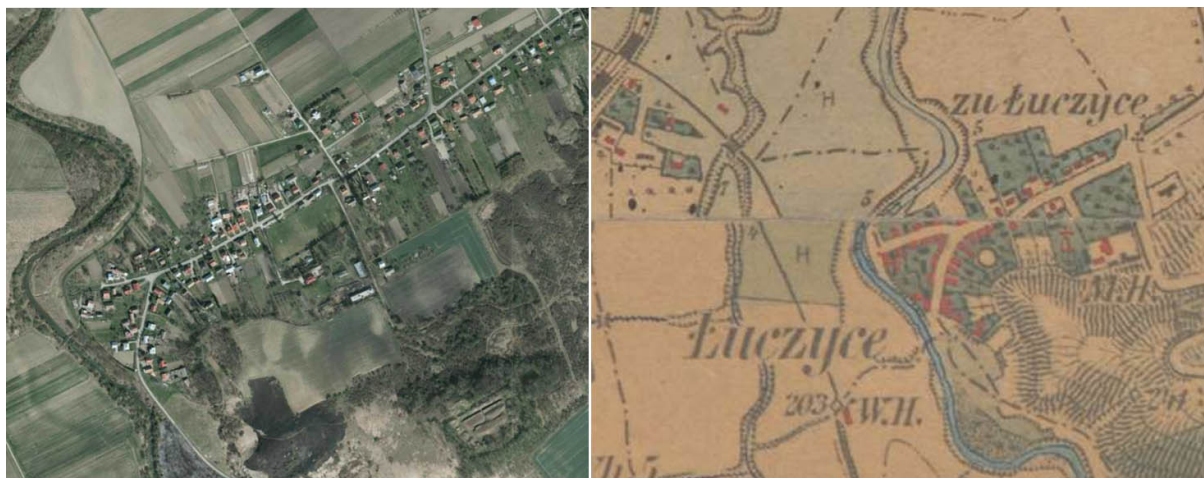
Ryc. 3. Łuczycy. Pozostałości parku. Mapa 1 - obecny stan ( www.geoportal.gov.pl ), mapa 2 - XIX w. ( www.mapire.eu ).

Pozostałości parku dworskiego w Łuczycach. W miejscowości znajdują się pozostałości parku dworskiego z 2 połowy XVIII wieku. Obecnie park jest słabo widoczny w terenie. Na jego obszarze znajduje się boisko sportowe oraz budynek mieszkalny i budynki gospodarcze.