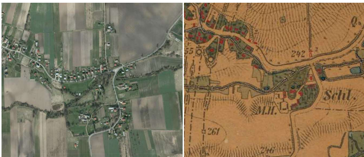
Ryc. 1. Grochowce. Pozostałości parku. Mapa 1 - obecny stan ( www.geoportal.gov.pl ), mapa 2 - XIX w. ( www.mapire.eu ).