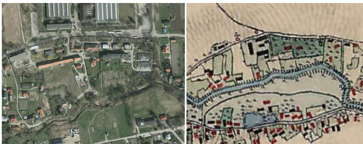
Ryc. 4. Nehrybka. Zespół dworsko-folwarczny. Mapa 1 - obecny stan ( www.geoportal.gov.pl ), mapa 2 - XIX w. ( www.mapire.eu ).

Zespół dworsko-folwarczny w Nehrybce (rejestr zabytków A-837 z 17.06.1996 r.). Zespół usytuowany jest w północnej części wsi, przy jej granicy z miastem Przemyślem, którą stanowi ul. Obozowa. Teren opada w kierunku południowy ku rzeczce Jawor oddzielającej zespół od zabudowy wiejskiej od ul. Obozowej.