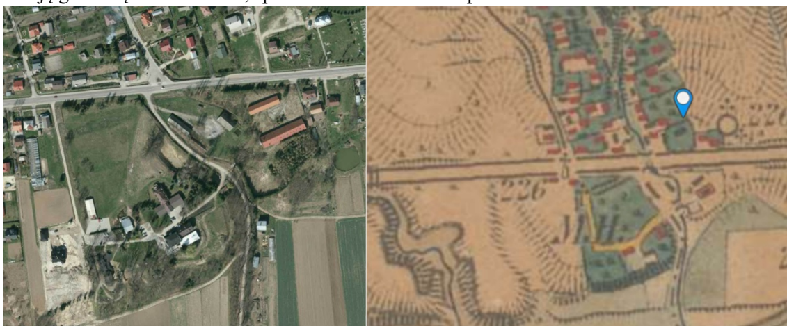
Ryc. 6. Wapowce. Zespół dworsko-parkowy. Mapa 1 - obecny stan ( www.geoportal.gov.pl ), mapa 2 - XIX w. ( www.mapire.eu ).

Zespół dworsko-parkowy w Wapowcach. Wapowce powstały jeszcze przed 1436 r., jako prywatna wieś Wapowskich herbu Nieczuja. Przez następane trzy wieki Wapowce były gniazdem tego rodu, którego przedstawiciele piastowali wysokie godności w województwie ruskim. W XV w. na miejscu obecnego dworu w Wapowcach stał gród, przebudowany na dwór drewniany, który po pożarze zamieniono na murowany. Obecnie z zespołu zachowany jest fragmentarycznie park z XVIII w. z aleją grabową z XIX/XX w., spichlerz oraz stodoła z 1 poł. XIX w.