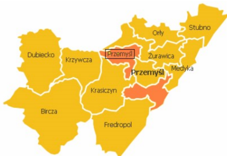
Mapa. 1. Gmina Przemysł na tle Powiatu Przemyskiego.