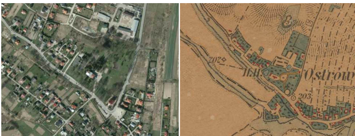
Ryc. 5. Ostrow. Zespół dworsko-parkowy. Mapa 1 - obecny stan ( www.geoportal.gov.pl ), mapa 2 - XIX w. ( www.mapire.eu ).

Zespół dworsko-parkowy w Ostrowie. Zespół z ok. połowy XIX w. należał do Rodziny Świeżawskich. Obecnie zachowany jest budynek dworu (rejestr zabytków A-35 z 19.02.1986 r.), gdzie mieści się Zespół Szkół, murowana obora (rejestr zabytków A-346 z 13.12.1989 r.), oraz pozostałości parku (rejestr zabytków A-35 z 19.02.1986 r.). Zachowany drzewostan to m.in. jesiony, klony polne, jawory, graby, lipy, modrzewie, wierzba płacząca oraz buk.