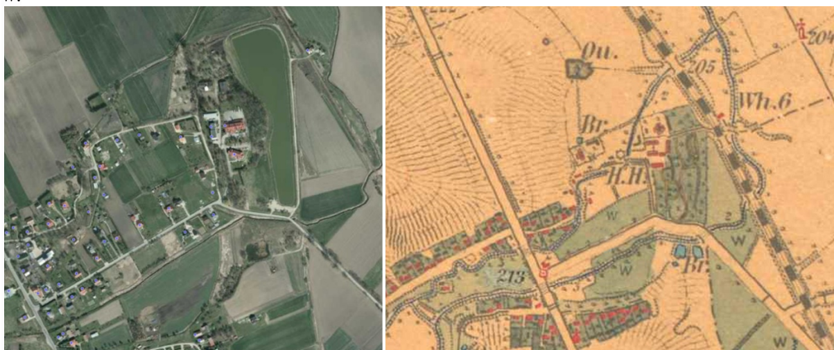
Ryc. 2. Hermanowice. Pozostałości parku. Mapa 1 - obecny stan ( www.geoportal.gov.pl ), mapa 2 - XIX w. ( www.mapire.eu ).

Pozostałości parku dworskiego w Hermanowicach. We wsi Hermanowice istniał okazały dwór, który spłonął podczas I wojny światowej. Zachowały się jedynie fragmenty parku z XVIII/XIX w.