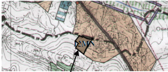
GRANICE OBSZARU OBJĘTEGO ZMIANĄ PLANU

WYRYS ZE STUDIUM UWARUNKOWAŃ I KIERUNKÓW ZAGOSPODAROWANIA PRZESTRZENNEGO GMINY NOWY ŻMIGRÓD SKALA 1:10 000