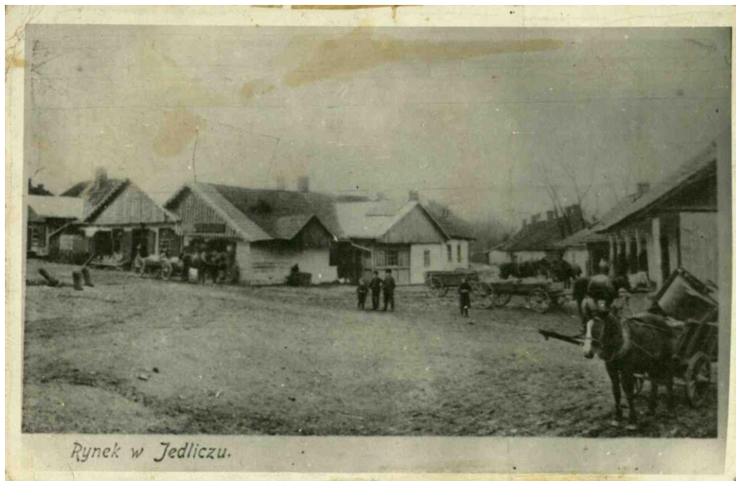
Ilustracja 2 - Rynek w Jedliczu. Poczta z pocz. XX w.