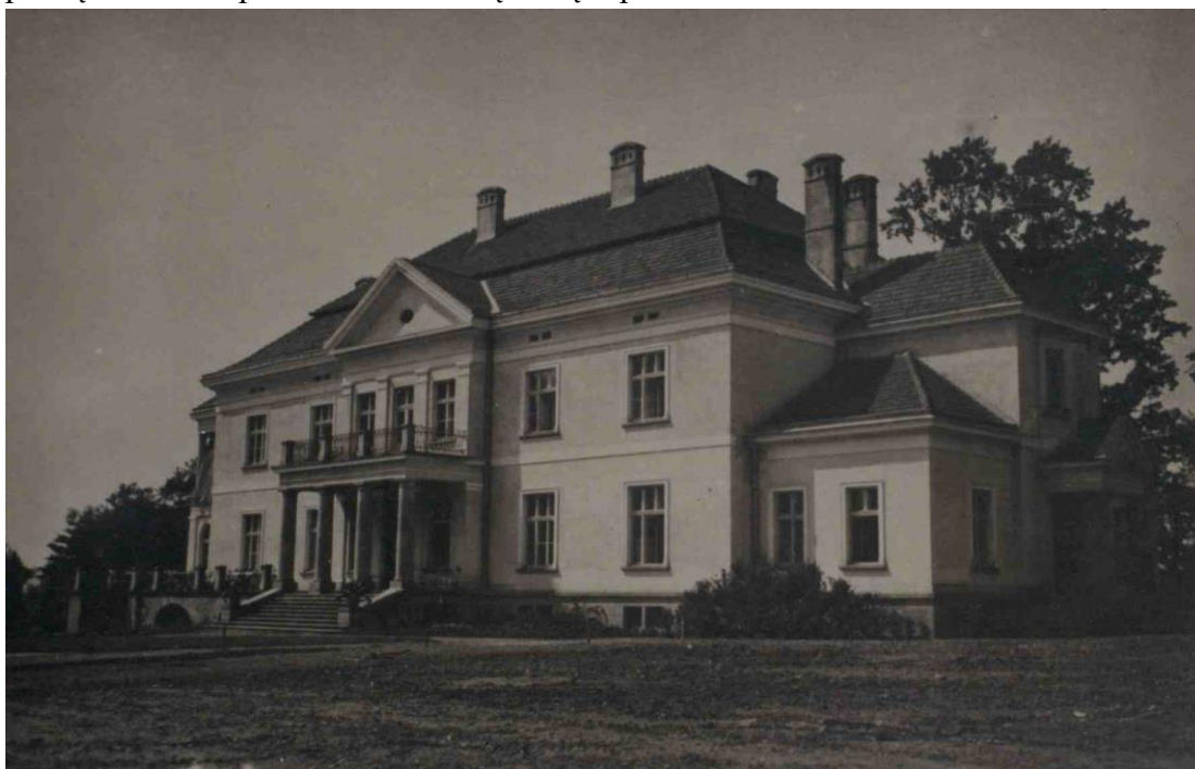
Ilustracja 6- Pałac Stawiarskich w Jedliczu. Fotografia z lat 20. XX w.

Pałac Stawiarskich otacza zabytkowy park krajobrazowy z licznymi starymi dębami. Głównym elementem parku są liczne drzewa, z przewagą dębu szypułkowego. Najokazalszy z nich u podstawy skarpy ma 700 cm obwodu. Występują także graby pospolite, jesiony wyniosłe, lipy szerokolistne, a zwłaszcza wielopniowy klon jawor. Niektóre z nich osiągnęły imponujące rozmiary. Z drzew obcego pochodzenia występują: sosna czarna i cyprysik groszkowy. Na początku XX w. posadzono na dużą skalę topole wielkolistne.