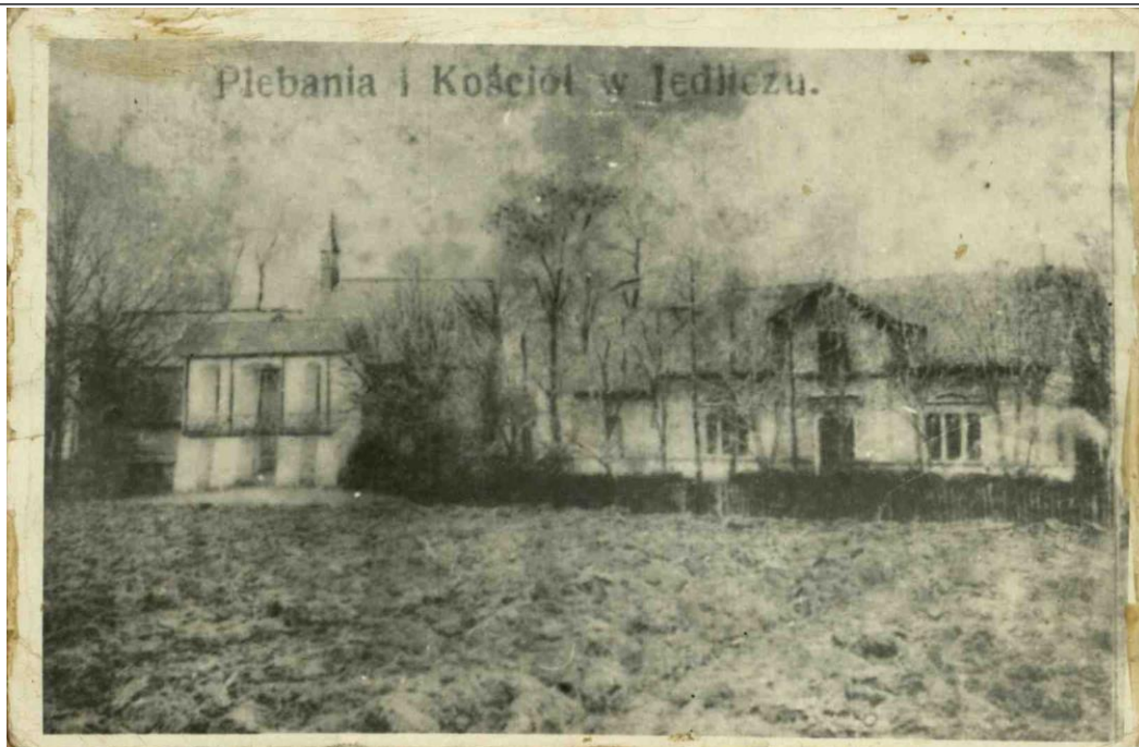
Ilustracja 3 - Plebania i kościół w Jedliczu. Poczta z pocz. XX w.