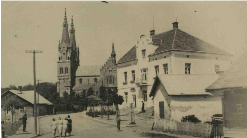
Ilustracja 1 - Rynek w Jedliczu. Fotografia z 1942 r.