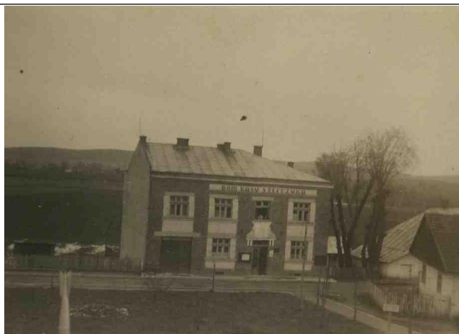
Ilustracja 8 - Dom Kasy Stefczyka. Fotografia z lat 40. XX w.