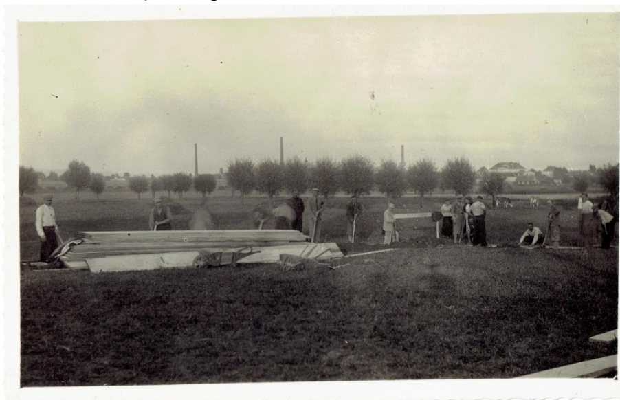
Ilustracja 7-Prace przy budowie fundamentów pod Dom Legionowo-Strzelecki w Jedliczu, 1935

W okresie okupacji w budynku przez pewien czas stacjonowało wojsko niemieckie oraz miała swoją siedzibę Szkoła Powszechna w Jedliczu. Po II wojnie światowej budynek legionowo-strzelecki został przejęty na rzecz Skarbu Państwa. Służył jako obiekt użyteczności publicznej, w którym mieściły się m.in. Prezydium Miejskiej Rady Narodowej, Urząd Miasta i Gminy, Miejsko-Gminny Ośrodek Sportu i Rekreacji, miejscowy ośrodek kultury. Obecnie