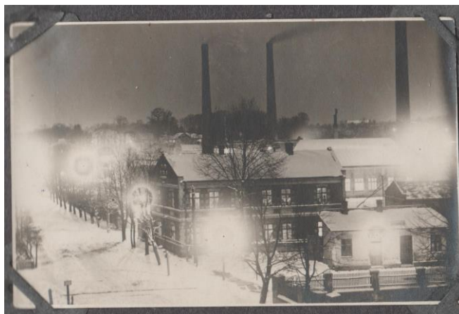
Ilustracja 11 - Rafineria Nafty w Jedliczu, fotografia wykonana nocą, lata 30. XX w.

Od południowo-zachodniej strony do zespołu rafinerii przylega zespół budynków administracyjnych i mieszkalnych dla pracowników.