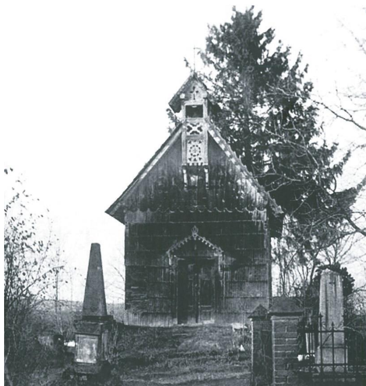
Ilustracja 5 - Kaplica pw. Jezusa Ukrzyżowanego – fotografia z lat 20. XX w.

Kaplica ta jest jednym z niewielu zachowanych w województwie podkarpackim drewnianych kościółków cmentarnych. Obiekt ten posiada duże znaczenie historyczne i kulturowe. Obecnie stanowi własność Gminy Jedlicze. W dniu 8.11.2007 r. Kaplica została wpisana do krajowego rejestru zabytków pod numerem A-213. W tym samym roku do rejestru zabytków pod numerem B-207 w dniu 17 lipca wpisano również polichromię, mensę ołtarzową i krucyfiks.