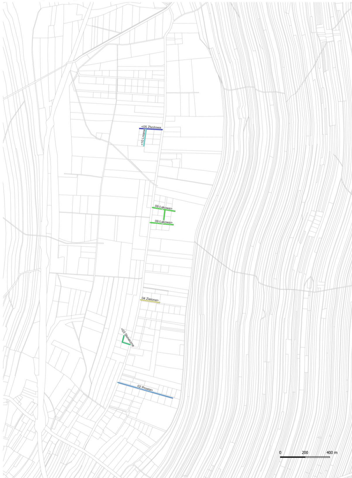
Nazewnictwo ulic w miejscowości Cmolas w gminie Cmolas