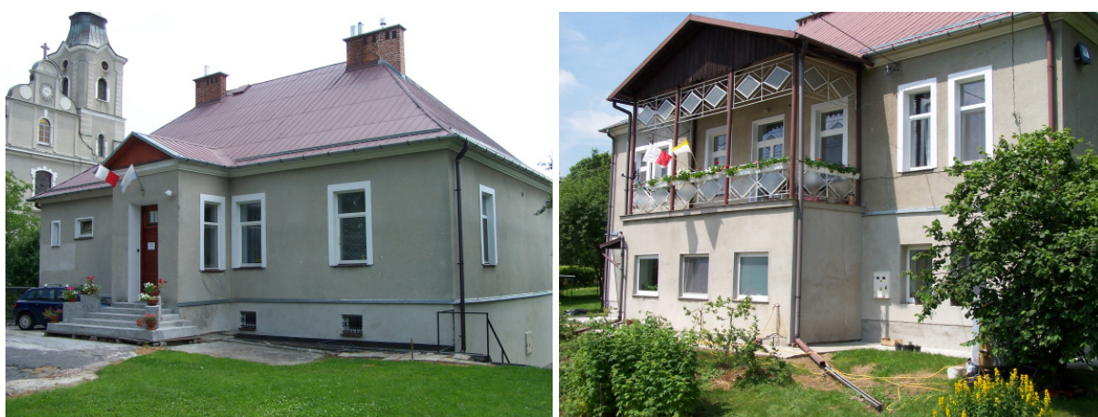
Fot. 13, 14. Plebania w Zgłobniu 27

Plebania została wzniesiona około roku 1892 w części zachodniej od kościoła, również na wzgórzu. Jest to budowla murowana i otynkowana. Kondygnacje w zależności od ukształtowania terenu – od północy ściana dolnej kondygnacji znajduje się poniżej poziomu posadowienia, - dwukondygnacyjna od południa. Rzut obiektu prostokątny ze zryzalitowanym gankiem wzdłuż osi frontowej. Od strony elewacji ogrodowej trzyosiowy ryzalit z balkonem. Dach czterospadowy, kryty blachą.