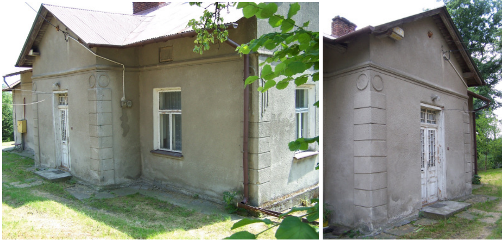
Fot. 15, 16. Wikarówka w Zgłobniu 28