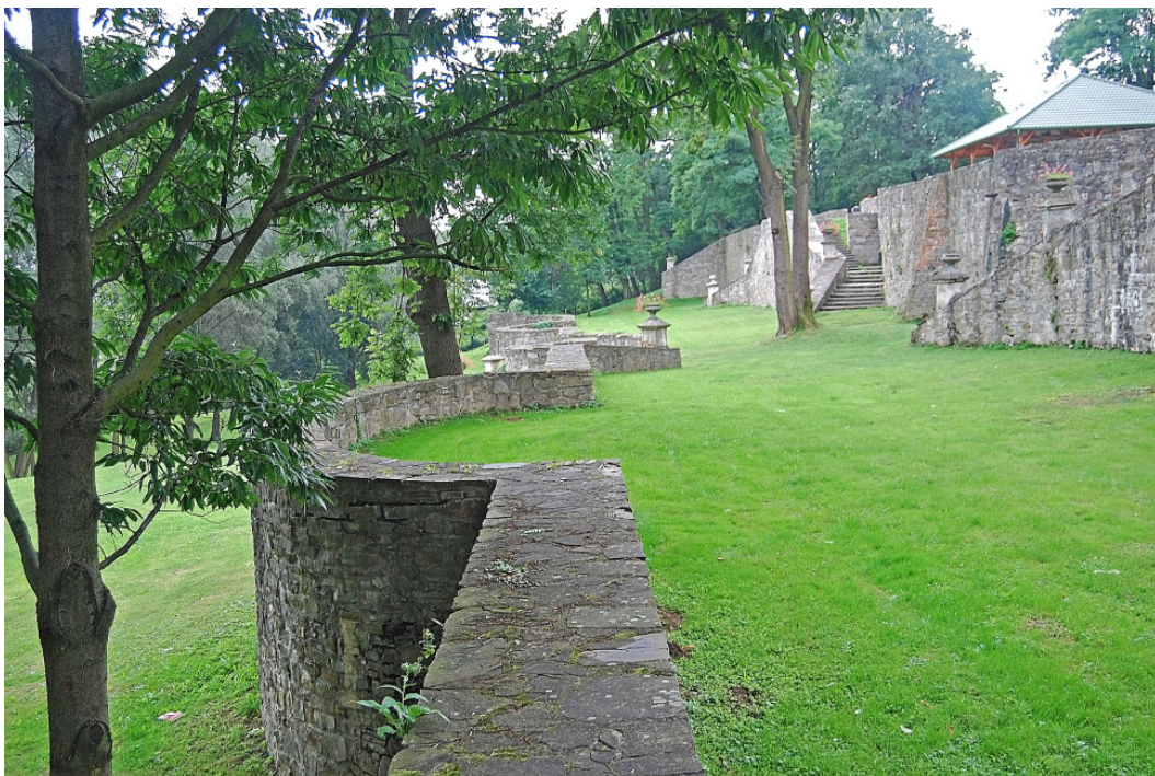
Fot. 6. Zróżnicowane poziomy terenu parku od strony wschodniej 20

Na przedłużeniu linii pałacu, w południowo – wschodniej części parku znajduje się punkt wysokościowy w kształcie murowanego, spiralnego kopca wypełnionego ziemią. Prawdopodobnie centralny element tej części ogrodu – niestety w chwili obecnej zaniedbany popada w ruinę. Po przeciwnej stronie, wjazd do parku od północnej strony umożliwiała pięknie kuta, dwuwahadłowa brama wkomponowana w zabytkowe ogrodzenie; z figurą Św. Jana Nepomucena.