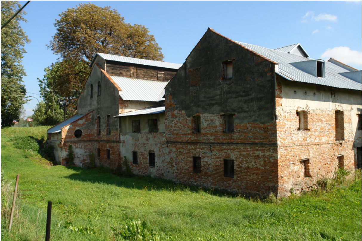
Fot. 8. Młyn Wodny w Boguchwale; widok od strony południowo – wschodniej w kierunku ul. Cichej 23

należyty sposób. 22 Tradycje młynarstwa w Boguchwale sięgają początków osady a rozwinęły się szczególnie w drugiej połowie XIX wieku. Młyn w Boguchwale zbudowany według nowych wzorów w latach 70 XIX wieku zastąpił stary obiekt. Był on własnością Straszewskich i w ówczesnych latach dawał systematycznie duże dochody gdyż najbliższe okolice w tym przedmieście Rzeszowa.