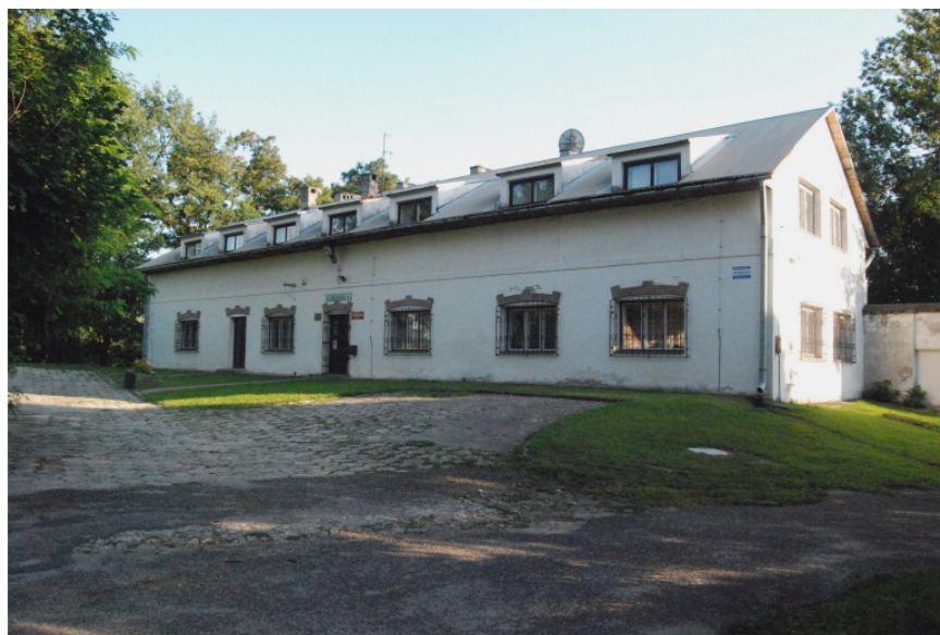
Fot. 23. Biblioteka w Boguchwale 33

2. W zespole pałacowo – ogrodowym spichlerz lub stajnia – znajdujący się na terenie Podkarpackiego Doradztwa Rolniczego w Boguchwale rolnego w Boguchwale; budynek murowany, ceglany, otynkowany, dwukondygnacyjny. W chwili obecnej siedziba Biblioteki Publicznej w Boguchwale oraz Biblioteki PODR.