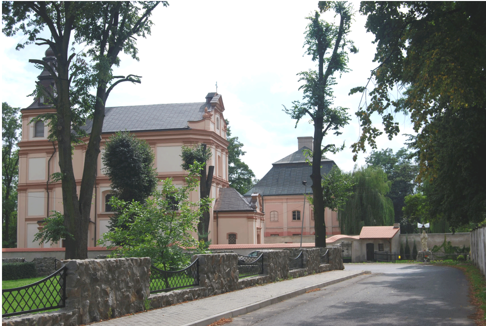
Fot. 1. Widok z ulicy Grunwaldzkiej na kościół p.w. Św. Stanisława Męczennika w Boguchwałe. 14