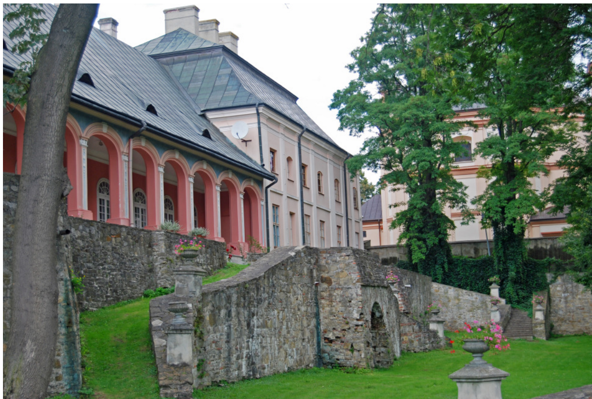
Fot. 5. Widok na galerię z podcieniami pałacu w Boguchwale 18