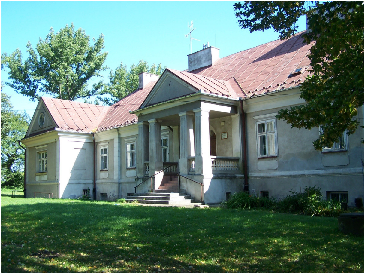
Fot. 9. Zespół parkowo – dworski w Zgłobniu; Dwór – obecnie WTZ 24

Spichlerz – były dwór – wzniesiony został w II połowie XVI wieku; przypuszcza się, że na spichlerz adoptowano go 200 lat później lub na przełomie XVIII/XIX wieku. Budynek murowany z cegły i kamienia, otynkowany. Jedna kondygnacja nadziemna, pod częścią obiektu piwnice. Wewnątrz trzy izby; w dwóch sklepienie kolebkowe i zachowane dwa renesansowe portale w części elewacji zachodniej; renesansowo obramowane okna. Tuż pod czterospadowym dachem, krytym eternitową dachówką, ściany zwieńczone profilowanym gzymsem.