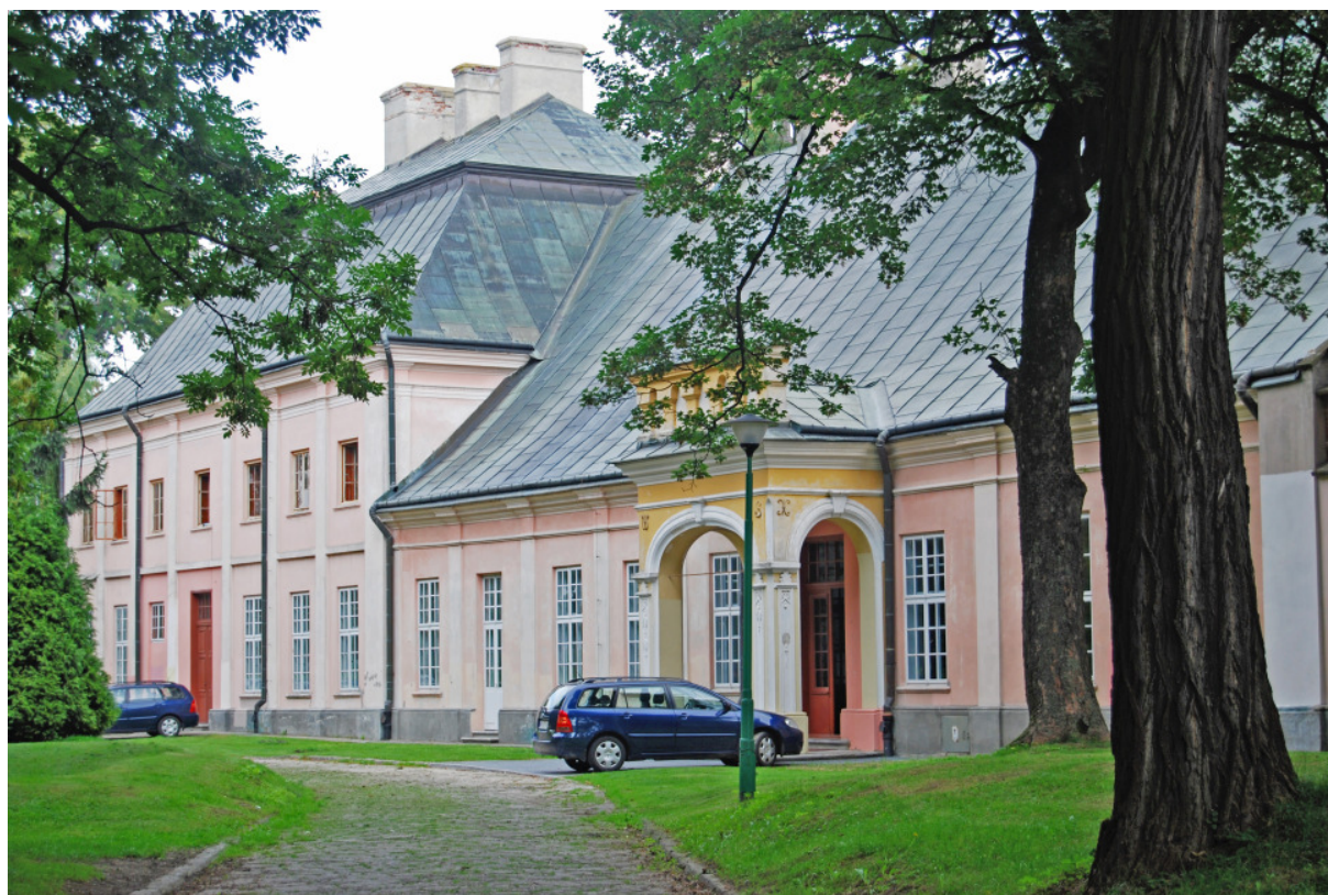
Fot. 4. Widok na Piętrowy pawilon i parterowy łącznik – zespół pałacowy w Boguchwale 17

Zespół pałacowy w Boguchwale został malowniczo usytuowany na rozległym obszarze opadającym znacznie na południowy – wschód, w otoczeniu parku od południa i wschodu, kościoła pod wezwaniem Św. Stanisława Męczennika od północy i zabudowy gospodarczej od zachodu. Obecny pałac stanowi fragment większej symetrycznej całości i składa się z piętrowego pawilonu i parterowego łącznika – składał się pierwotnie z trzech piętrowych pawilonów oraz dwóch parterowych łączników, jednak zniszczony pod koniec XVIII wieku nie został odbudowany w pierwotnej wersji. Człony te pomimo ujednoczenia zewnętrznej szaty architektonicznej różnią się nie tylko ilością kondygnacji, lecz przede wszystkim grubością murów szczególnie w miejscu ich wspólnej ściany – co świadczy o różnych fazach wyglądu i budowy obecnego obiektu. Rzut całości ma formę wydłużonego prostokąta, na który składają się rzuty prostokątne pawilonu i łącznika. Dach pawilonu mansardowy o dobrych proporcjach i zaokrągleniach w północnej stronie. Podział na kondygnacje zaznaczony jest gzymsem kordonowym. Okna nie posiadają naczółków ani opasek, co zwiększa wrażenie płaskości i linearności całości fasady.