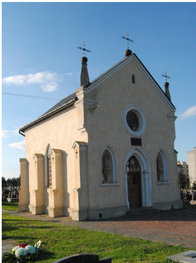
Fot. 24. Kaplica cmentarna w Boguchwale 34

W kolejnym etapie proponuje się wpisać do rejestru obiekty małej infrastruktury sakralnej znajdujące się na terenie gminy. Większość z nich została wyremontowana ze środków Urzędu Gminy, choć występują kapliczki, których stan pozostawia wiele do życzenia. „Zarejestrowanie” ich pozwoli powziąć pewne kroki w kierunku remontów, nawet tych znajdujących się na prywatnych posesjach. Wszystkie kapliczki ujęte są w Gminnej Ewidencji Zabytków.