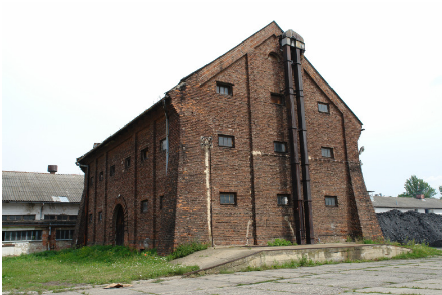
Fot. 22. Spichlerz w Boguchwale; obiekt na terenie byłego gospodarstwa rolnego 32

2. W zespole pałacowo – ogrodowym spichlerz lub stajnia – znajdujący się na terenie Podkarpackiego Doradztwa Rolniczego w Boguchwale rolnego w Boguchwale; budynek murowany, ceglany, otynkowany, dwukondygnacyjny. W chwili obecnej siedziba Biblioteki Publicznej w Boguchwale oraz Biblioteki PODR.