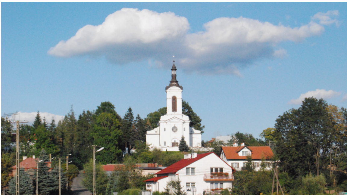
Fot. 19, 20,21. Zespół kościoła p.w. Wszystkich Świętych w Raclawówce – Zabierzów 30