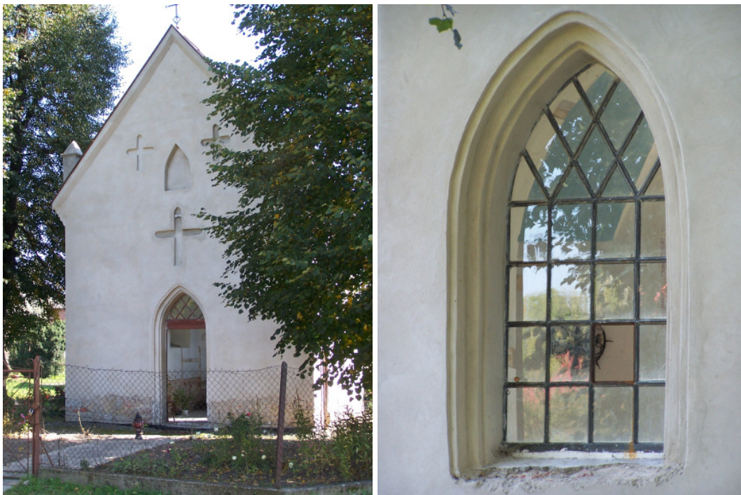
Fot. 17, 18. Kaplica Św. Marka w Zgłobniu 29

Kaplica Św. Marka położona jest na tzw. Pasterniku w Zgłobniu. Zgodnie z tradycją i przekazami została wzniesiona na miejscu drewnianego kościoła spalonego przez Tatarów w 1624 r. Budynek murowany z cegły, otynkowany. W najbliższym otoczeniu znajduje się „wieniec” lipowy. Kaplica na rzucie prostokąta; w części ołtarzowej zakończona trójbocznie, zwieńczona wysokim dachem dwuspadowym – od wschodniej części trójpołaciowym pokrytym cementową dachówką. Otwory okienne w ścianach ocznych ostrołukowe, rozglifione do wewnątrz. W profilowanych obramieniach znajdują się ostrołukowe drzwi. Wnętrze jednoprzestrzenne ze sklepieniem krzyżowym.