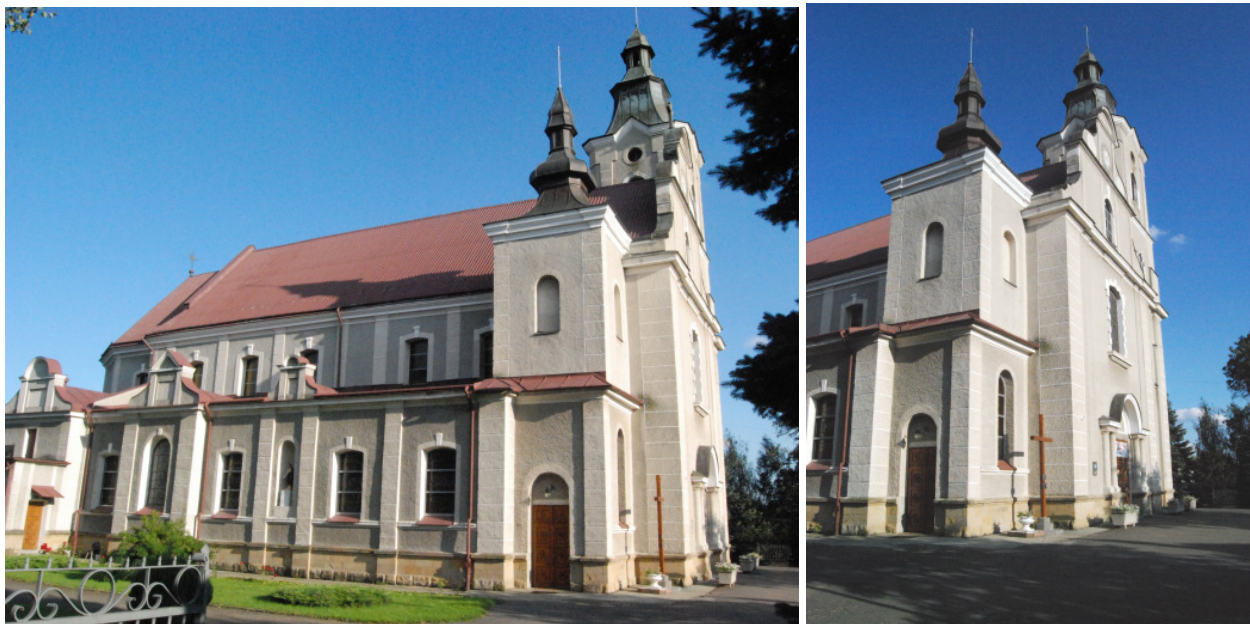
Fot. 11, 12. Kościół p.w. Św. Andrzeja Apostoła w Zgłobniu 26

Plebania została wzniesiona około roku 1892 w części zachodniej od kościoła, również na wzgórzu. Jest to budowla murowana i otynkowana. Kondygnacje w zależności od ukształtowania terenu – od północy ściana dolnej kondygnacji znajduje się poniżej poziomu posadowienia, - dwukondygnacyjna od południa. Rzut obiektu prostokątny ze zryzalitowanym gankiem wzdłuż osi frontowej. Od strony elewacji ogrodowej trzyosiowy ryzalit z balkonem. Dach czterospadowy, kryty blachą.