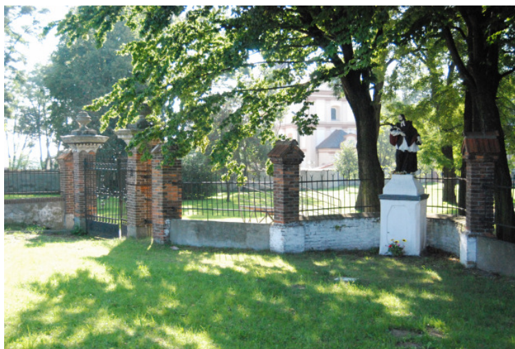
Fot. 7. Brama wjazdowa na teren pałacowo – parkowy; figura Św. Jana Nepomucena 21

Na przedłużeniu linii pałacu, w południowo – wschodniej części parku znajduje się punkt wysokościowy w kształcie murowanego, spiralnego kopca wypełnionego ziemią. Prawdopodobnie centralny element tej części ogrodu – niestety w chwili obecnej zaniedbany popada w ruinę. Po przeciwnej stronie, wjazd do parku od północnej strony umożliwiała pięknie kuta, dwuwahadłowa brama wkomponowana w zabytkowe ogrodzenie; z figurą Św. Jana Nepomucena.