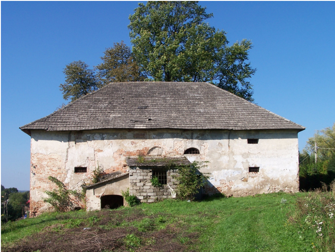
Fot. 10. Stary Dwór w Zgłobniu 25